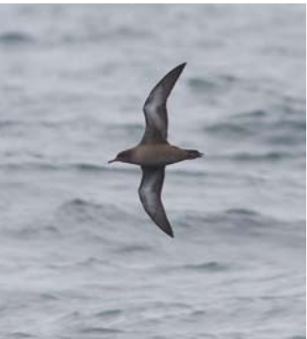
Grålire Puffinus griseus vest av Austevoll 8. september 2012.

1 ind. vest for Marsteinen, Sund 8.9 (Frode Falkenberg, Arild Breistøl, Lars Ågren m.fl.).