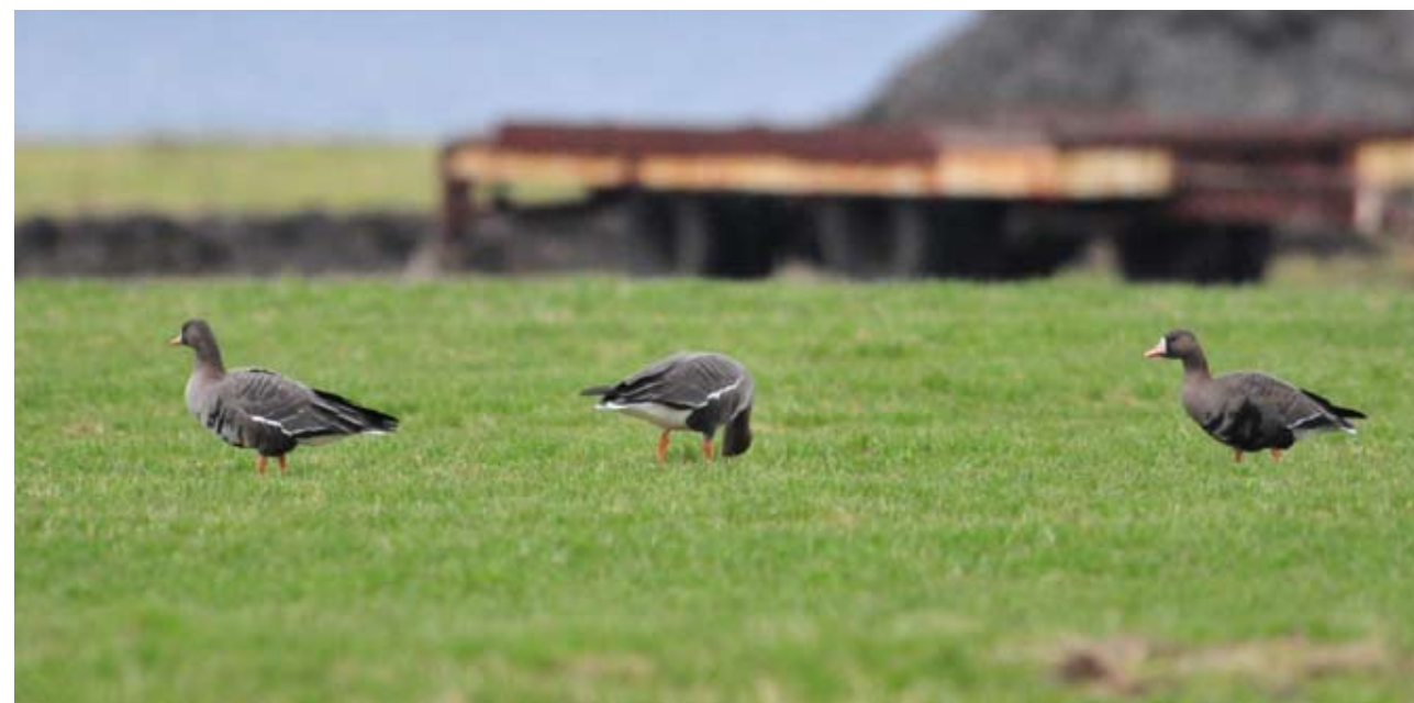
Østlige tundragjess Anser albifrons flavirostris på Herdla, Askøy 17. januar 2012.

Fugler av underarten B. b. hrota : 40 ptN Fedje 24.5 (Ola Moen). 200 ptN Herdlevær, Øyg. 24.5 (Lars Ågren, Terje Hansen). 143 ptN Skogsøytuva, Øyg. 27.5 (Bjørn-Atle Albrektsen). 305 ptN Herdlevær, Øyg. 28.5 (Håvard Husebø, Terje Hansen, Bjørnar Skjold m.fl.). 32 ptN Skogsøy, Øyg. 30.5 (Julian Bell). 30 ptN Skogsøytuva, Øyg. 1.6 (Julian Bell,