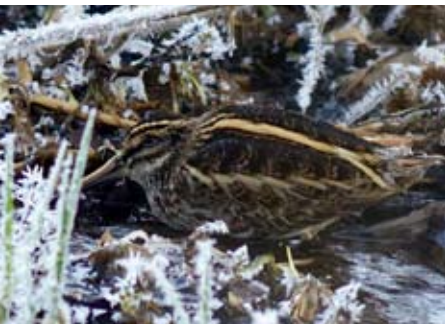
Kvartbekkasin Lymnocyptes minimus Storetveit, Bergen 22. desember 2012.