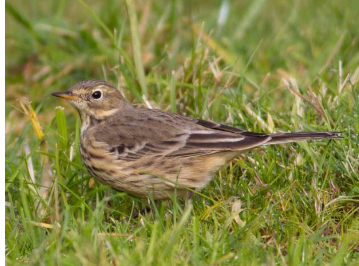
Myrpiplerke Anthus rubescens på Tjeldstø i Øygarden 11. oktober 2012. Første funn i Hordaland.

Delichon urbicum Årets første var 1 ind. Storavatnet, Be. 26.4 (Terje Hansen). Årets siste var 2 ind. Olsnesøy, Osterøy 9.10 (Øyvind Rulnes).