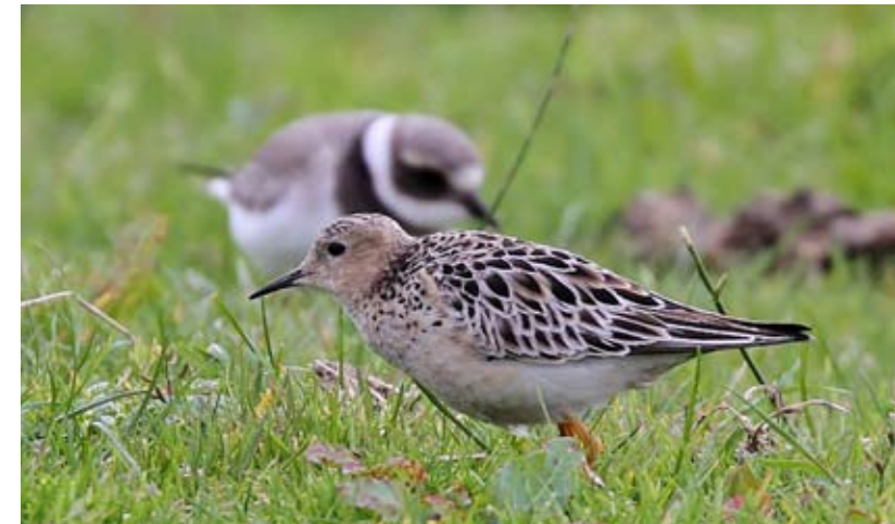
Rustsnipe Tryngites subruficollis på Herdla, Askøy 27. august 2012.

Alle funn utenfor fjellområder; 1 ind. Tjeldstø, Øyg. 24.5 (Bjørnar Skjold). 1 ind. Herdla, As. 29.5-2.6 (*Terje Hansen, Bert de Bruin,