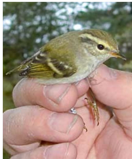
Gulbrynsanger Phylloscopus inornatus på Hiskjø, Bømlø 26. september 2012.

Årets første fugl ble hørt syngende 30.4 ved Eknes, Lindås (Morten Wilhelmsen), og årets siste var 1 ind. ved Tjeldstø, Øyg. 15.10 (Jørn Opsal, Terje Lislevand, Bjarne Andersen)