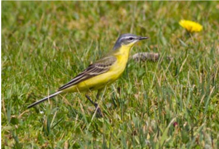
Sørlig gulerle Motacilla flava flava på Fedje 24. mai 2012.