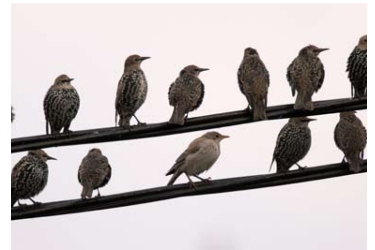
Ung rosenstær Sturnus roseus sammen med stær på Herdla, Askøy 7. september 2012.

1 ind. Fyllingsdalen - Bergen sentrum - Skansen, Be. 24.1-14.3 (*Frode Falkenberg, *Trond Berg m.fl.). 1 ind. Sævarhagsvikjø, Stord 2.3-31.12 (*Stein Haldorsen, Tor Helge Heggland m.fl.). 1 ind. Tjeldstø, Øyg. 6.5 (Julian Bell). 1 ind. Stormark, Fedje 6.5 (Arild Breistøl, Frode Falkenberg). 1 ind. Herdla, As. 12.5-22.5 (*Stein Byrkjeland, *Livar Frøyland, Terje Haugland m.fl.). 1 ind. Etne sentrum, Etne 14.5-16.5 (Terje Håheim). 1 ind. Lynghaugtjern, Be. 24.11 (Anders Bjordal).