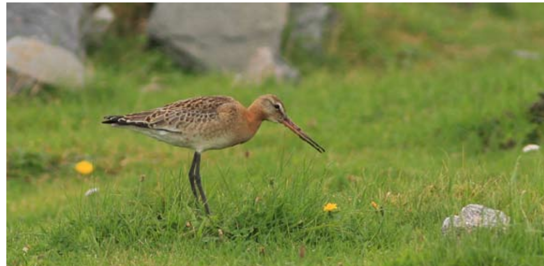
Ung svarthalespove Limosa limosa på Herdla, Askøy 12. september 2012.

Årets første var 1 ptN Skogsøytuva, Øyg. 1.5 (Bjarne B L Andersen, Terje Hansen, Harald Totland m.fl.).