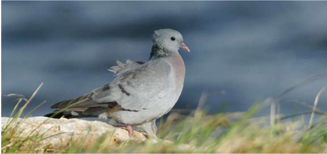
Skogdue Columba oenas på fedje 7. oktober 2012.