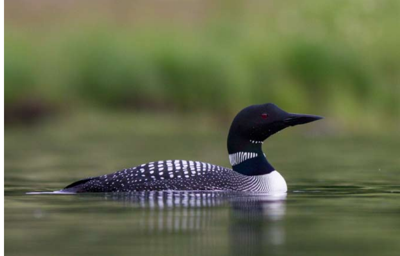
Denne islomen Gavia immer tilbragte sommeren 2012 i Fusa og Samnanger. Bildet viser fuglen fra Frølandsvatnet i Samnanger 19. juli 2012.