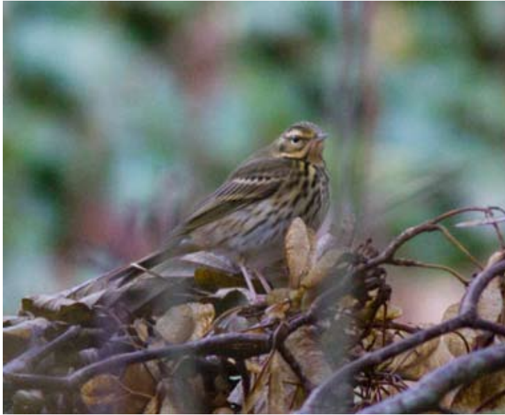
Sibirpiplerke Anthus hodgsoni Grunnosen, Austrheim 19. oktober 2012.