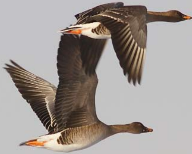
Sædgjess Anser fabalis på Herdla, Askøy 27. desember 2012.