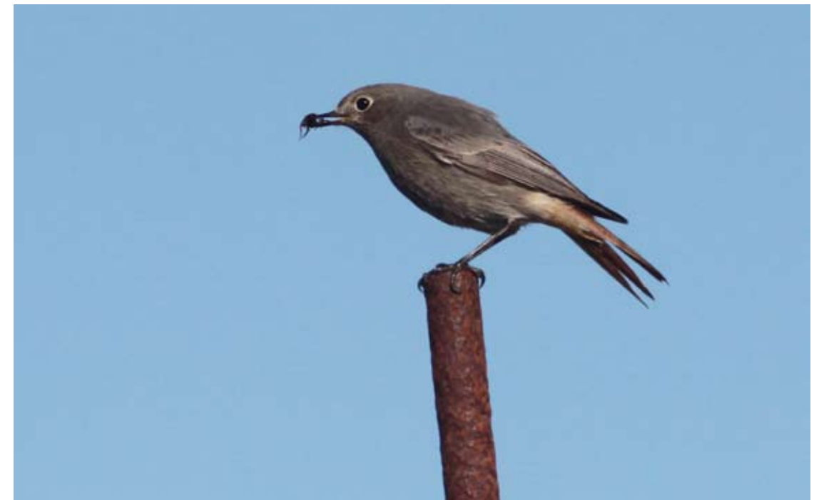
Svartrødstjert Phoenicurus ochruros på Herdlevær i Øygarden 24.3 2012.