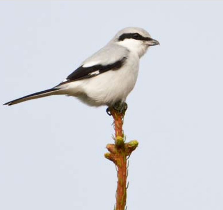
Varsler Lanius excubitor nær Etne sentrum 13. november 2012.