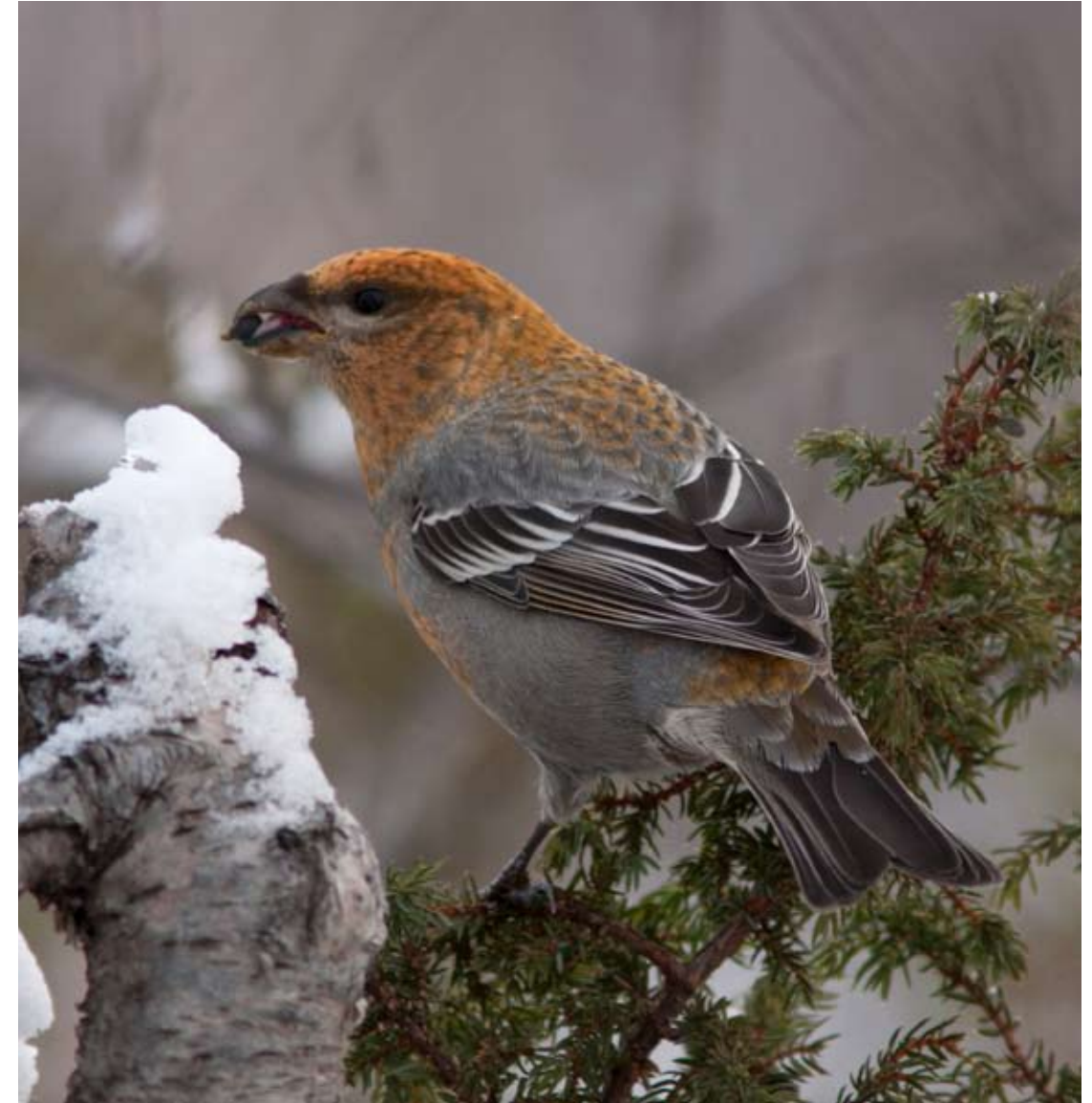
En av tre konglebit Picicola enucleator på Seljestad, Odda 29. november 2012.

1 par Nygårdsparken, Be. 14.1 (*Dag H Gjerde, Ingrid Gjerde m.fl.). 2 ind. Skjold, Øyg. 8.4 (Bjørnar Skjold). 1 ind. Herdlevær, Øyg. 4.11 (Bert de Bruin). 2009: 1 F Herdlevær, Øyg. 30.12 2009 (Ragnar Vikøren).