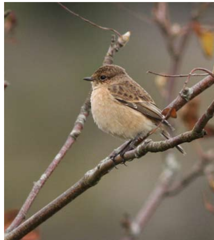
Asiasvartstrupe Saxicola maurus på Herdlevær i Øygarden 15. oktober 2012.