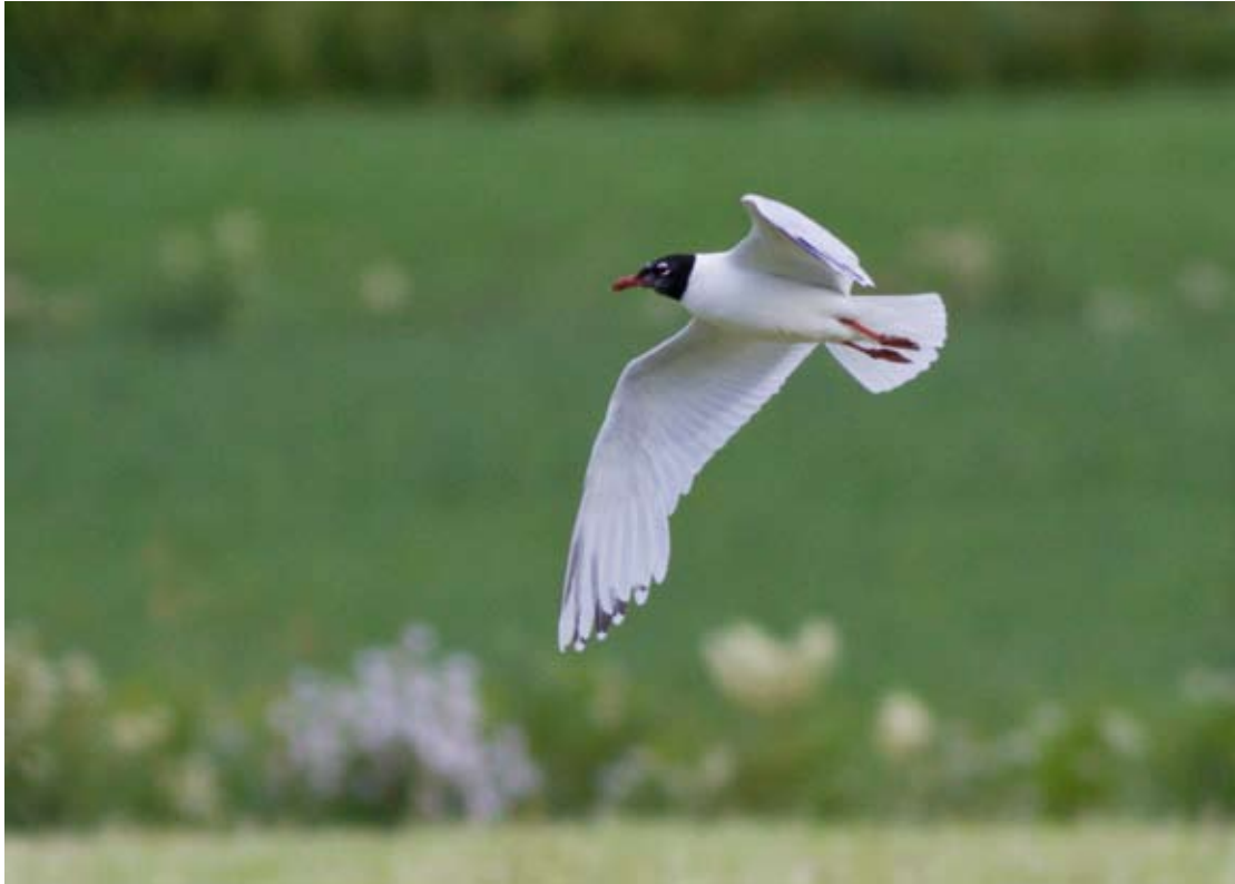
Svartehavsmåke Larus melanocephalus Steinsdalen, Kvam 20. juli 2012.