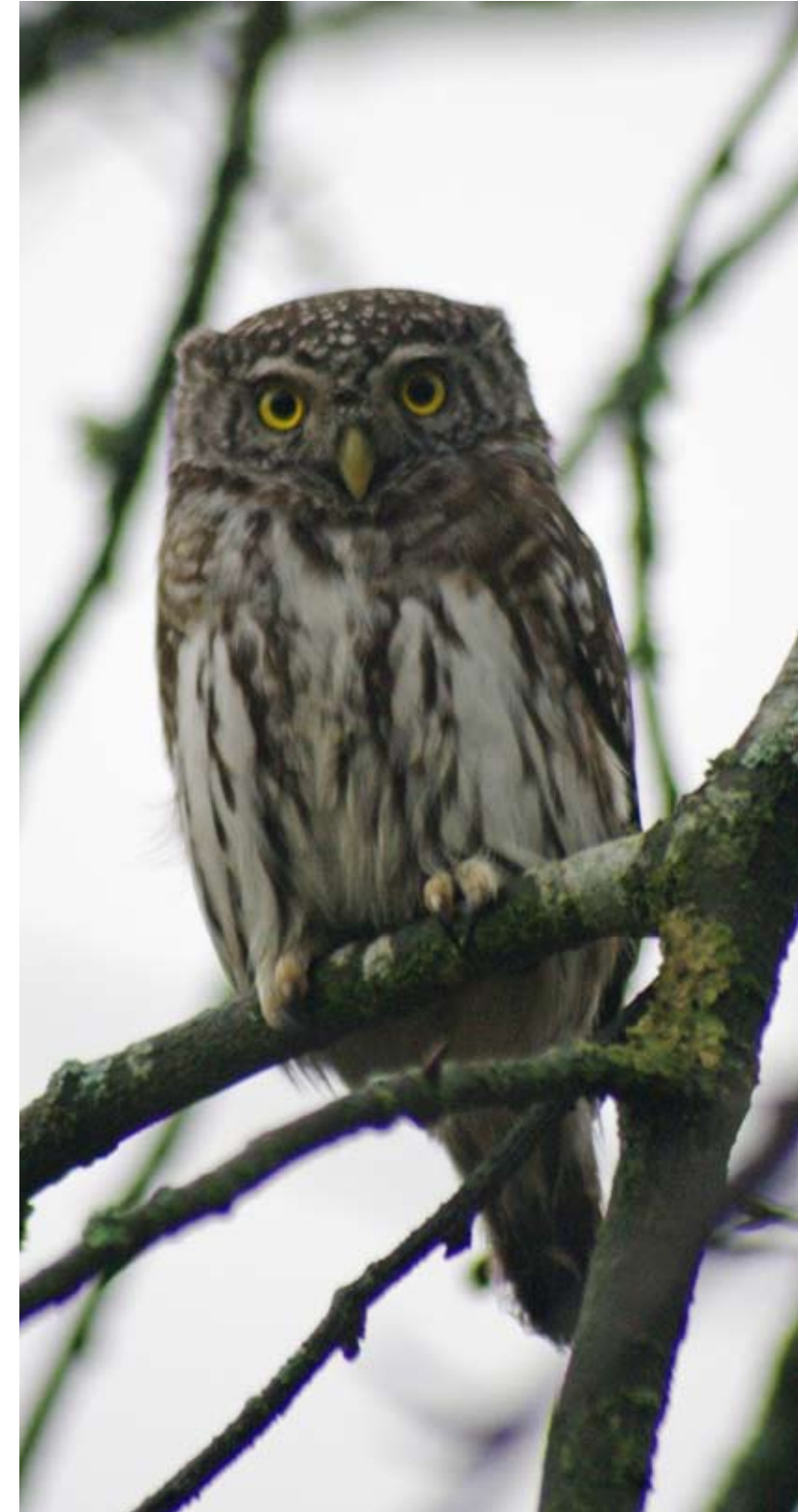
Spurveugle Glaucidium passerinum Storhaug, Kvinnherad 13.3 2012.