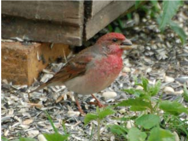
Rosenfink Carpodacus erythrinus fra en foringsplass i Øystese, Kvam 21. mai 2012.