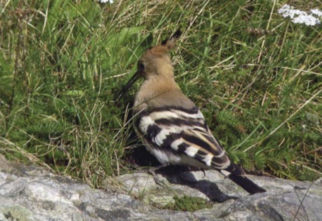
Årets eneste hørfugl Upupa epops var denne fuglen som var på Herdlevær i Øygarden 24. september 2005.