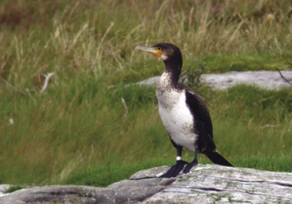
Storskarv av underarten mellomskarv Phalacrocorax carbo sinensis på Tjeldstø i Øygarden 1. september 2005. Ved identifikasjon av storskarvunderartene trengs meget gode observasjonsforhold eller god dokumentasjon. I vinkelen mellom munnvikene og barhudens bakkant ligger løsningen.

vasjoner utenom hekketiden inkluderer: 2 ad. Ådlandsvatnet, Stord 18.-26.2 og 1.-3.4, og 1 ad. s.st. 23.4 (THH). 2 ad. Hiskjo, Bømlo 7.3 (KBE,OHA). 1 ad. Kyrkjeberget, Stord 24.-29.3 (THH). 2 ad. Førdepollen, Sveio 6.10 (THH). 2 ind. Haukås, Sveio 31.10 (LØK). 1 ad. Gjelmervik, Etne 4.12 (OHE). 4 ad. Eldøy, Stord 9.-14.12 (THH). 4 ad. Ådlandsvatnet, Stord 11.-30.12 (THH).